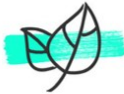
Energie & Klimaschutz